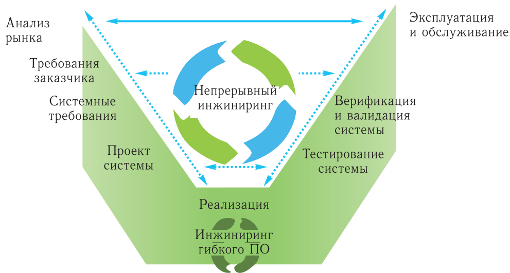
Рис. 1. V-диаграмма в представлении НИ [3]

формы КА необходимо начать проектирование с самой начальной точки — пересмотреть и изменить (при необходимости) базовые требования к изделию. Однако в таком случае становится понятным, что, возможно, будет необходимо осуществить полный цикл переработки комплекса, что потребует значительного времени и финансовых ресурсов.